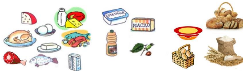
Рис.2 Какие вещества содержат продукты ?