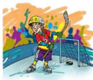
Рис. 1 Коля Булкин и Макс Орлов