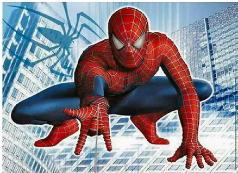
Рис.1 Человек паук