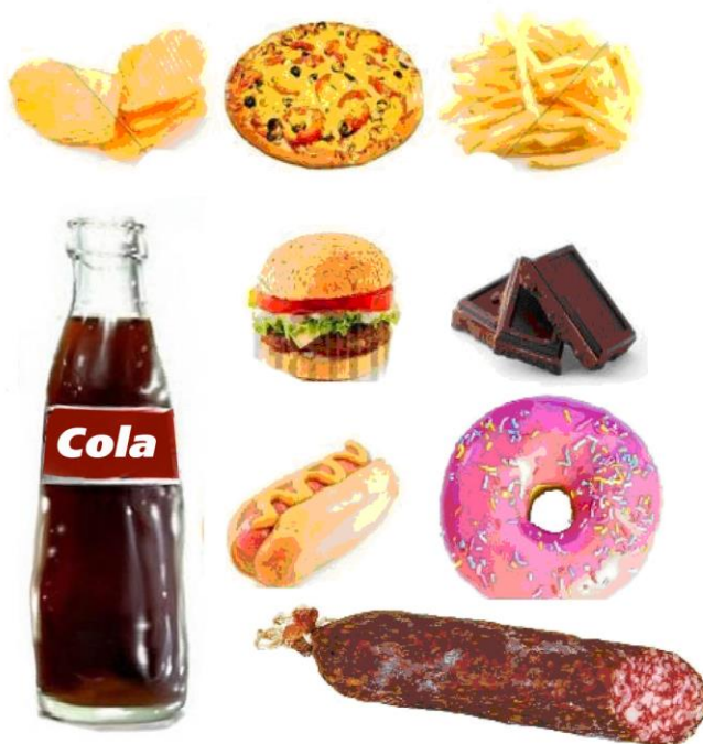
Рис.1 Вредные продукты