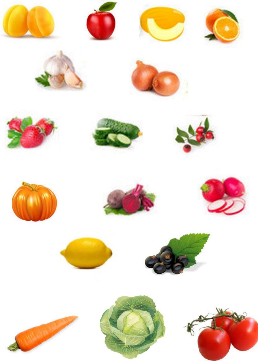
Рис.1 Какие витамины содержат овощи и фрукты?