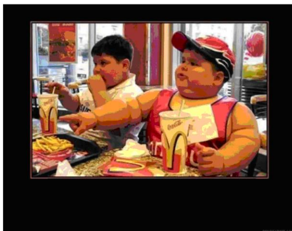
Рис.2 Ребенок, который питается гамбургерами.