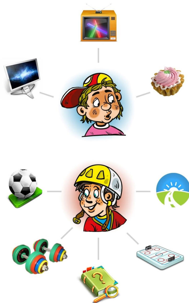
Рис.1 Что успели сделать за день Коля и Макс ?