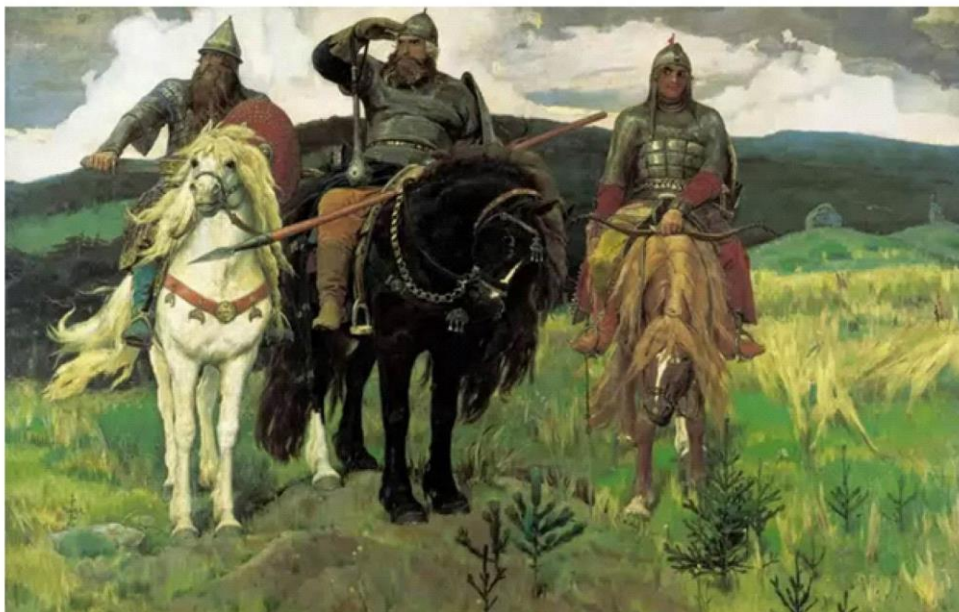
Рис.1 Репродукция картины В.Васнецова «Богатыри».