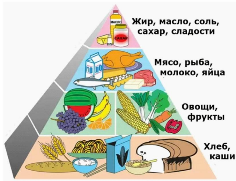
Рис.1 Пирамида питания (Сайт «Истинные ценности»)